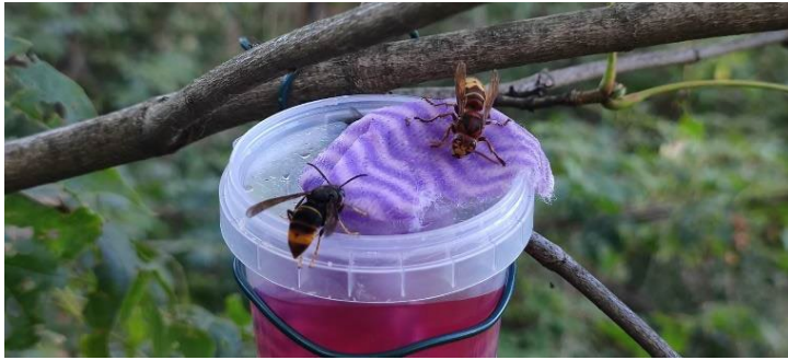
Asiatische und europäische Hornisse am Locktopf